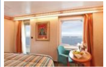
MS 全景陽臺小型套房 (約 25 ㎡)