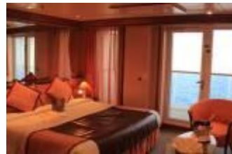
S 全景陽臺套房 (約 35 ㎡)