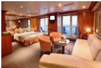
GS 豪華全景陽臺套房 (約 45 ㎡)