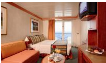
陽台房 (約 20 ㎡)