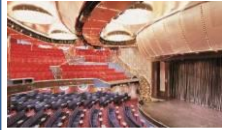
卡魯索大劇院 Caruso Theater