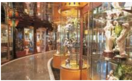
免稅商店 Via Della Spiga Shops