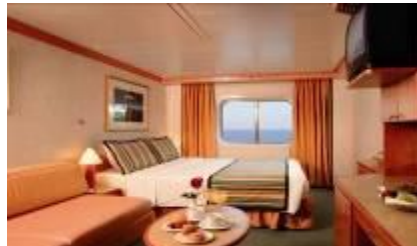
海景房 (約 18 ㎡)