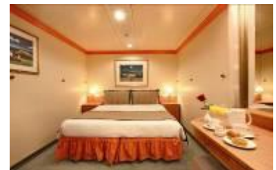
內艙房 (約 15 ㎡)

每間客艙最多可容納 2~4 名乘客，配有 1 張双人大床（可拆分成兩張单人床），部分房間配備 1-2 張伸拉式折疊床；獨立衛生間配備淋浴，梳妝台，吹風機；配備有液晶電視，會客沙發，保險箱，迷你冰箱，電話，熱水壺，24 小時客艙服務等（套房配備私人管家及浴缸）。