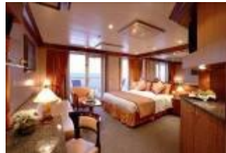
PS 高級全景陽臺套房 (約 40 ㎡)