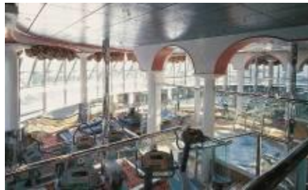
奥林匹亚健身中心 Olympia Gym